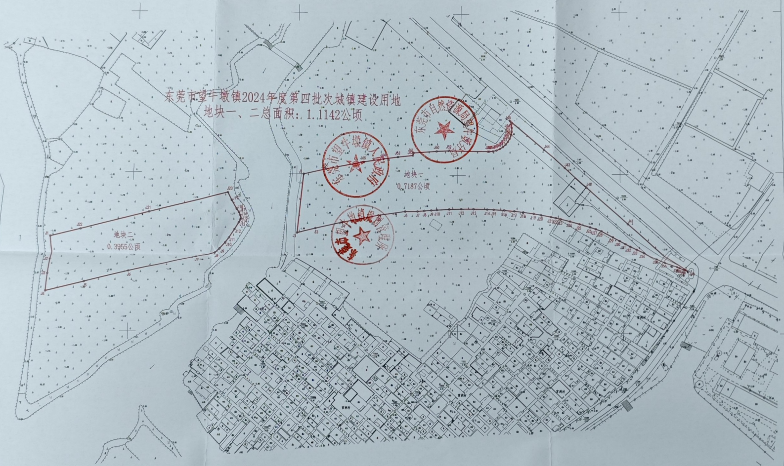
地块二界址点坐标表

东莞市望牛墩镇2024年度第四批次城镇建设用地图 地块一、二总面积: 1.1142公顷