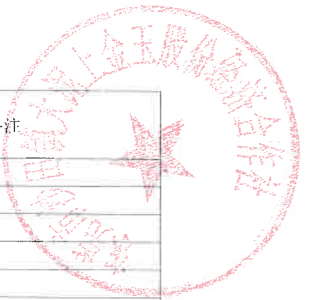
应纳入养老保障范围的被征地农民名单