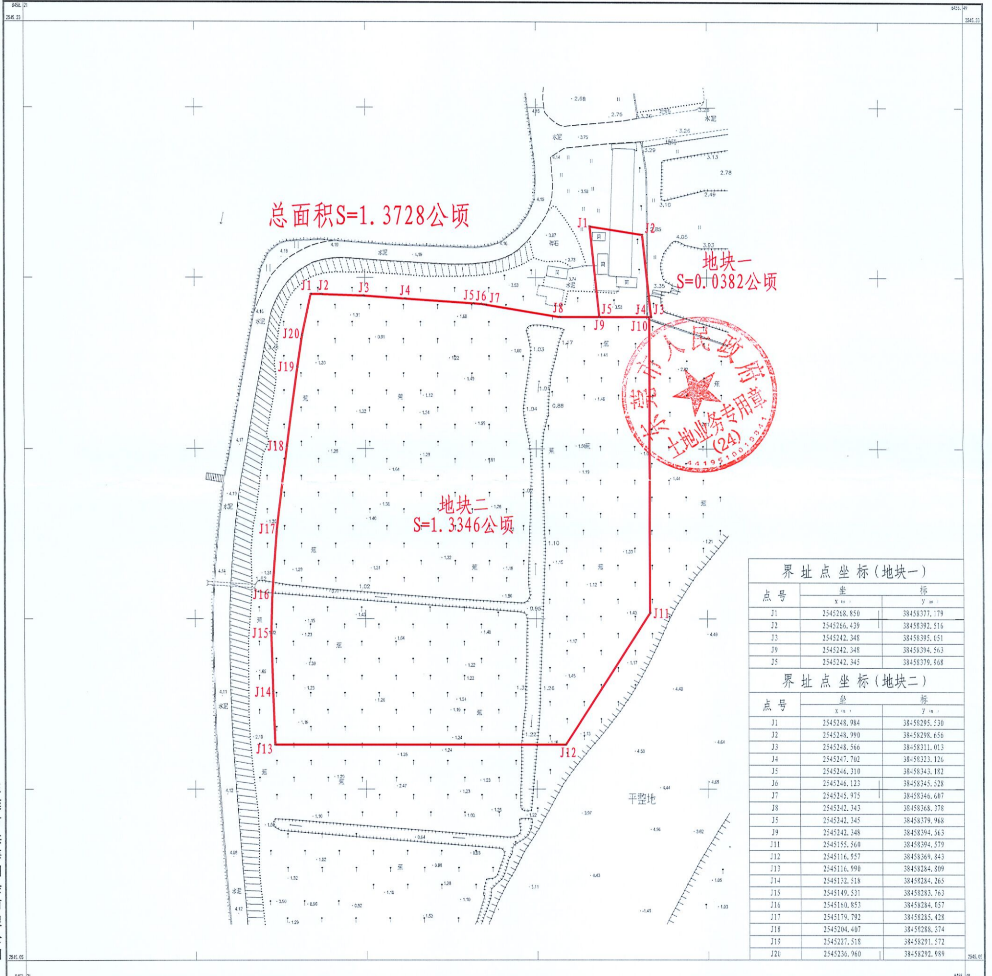
界址点坐标(地块一)