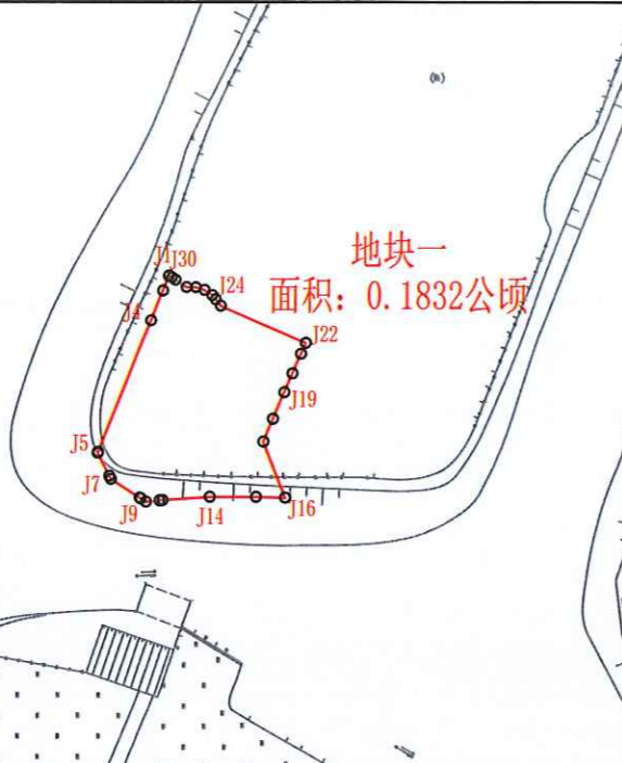
地块三界址点成果表