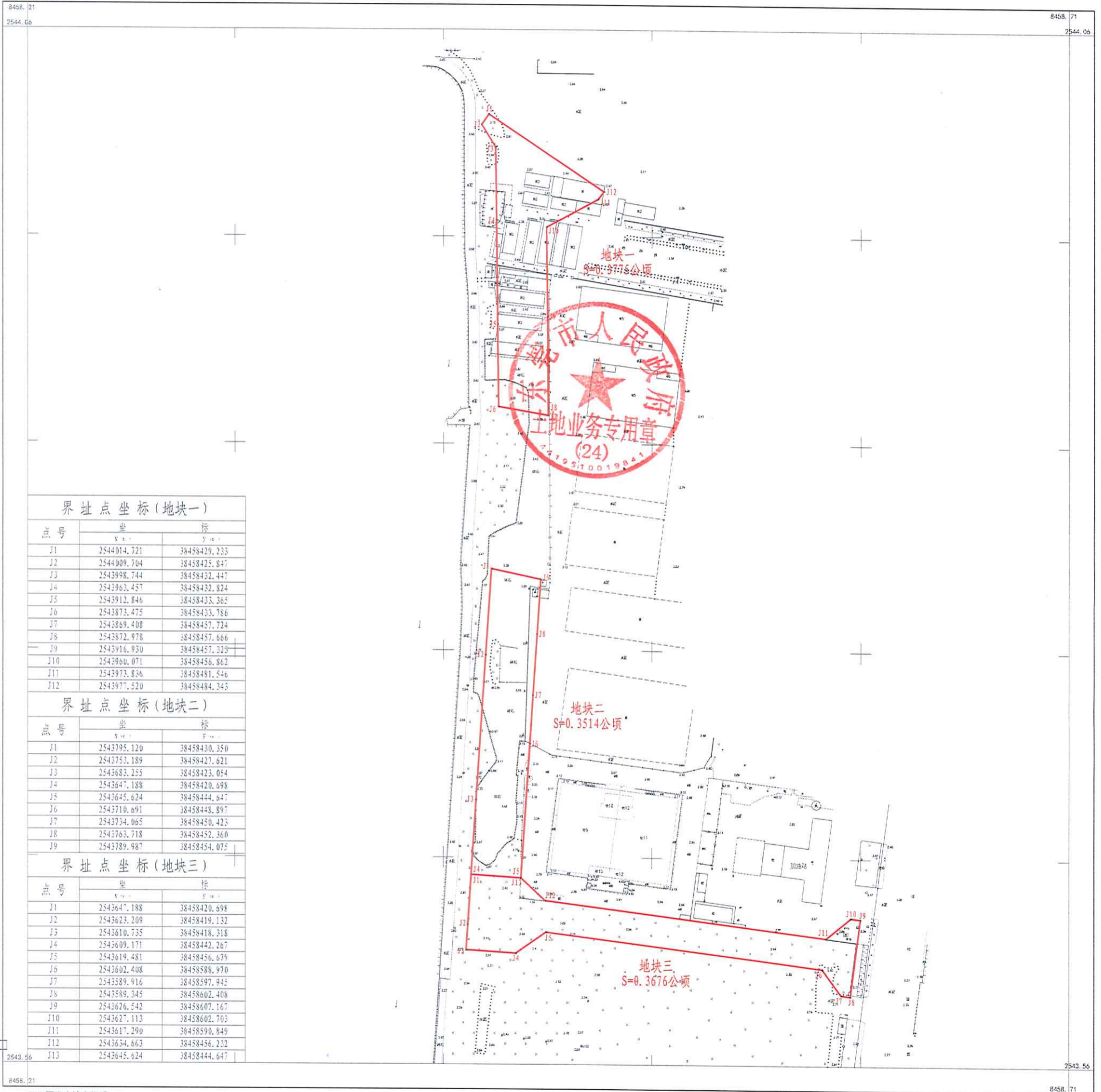
界址点坐标(地块一)